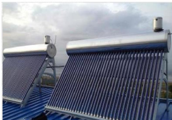
Рисунок 1 – Внешний вид вакуумных (трубчатых) солнечных коллекторов

Для установки системы солнечных коллекторов могут быть предложены два варианта: