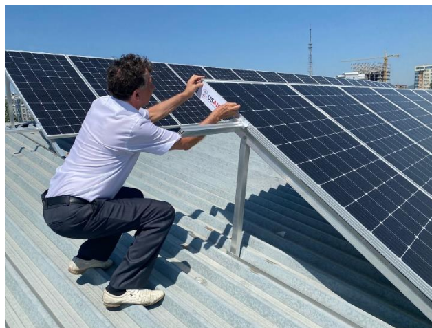
Рисунок 2 – Внешний вид солнечных панелей на крыше здания

Технико-экономические показатели работы системы зависят от места расположения и мощности солнечной системы, в том числе удаленность расположения